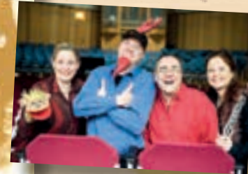
Kindertheater des Monats NRW im Sommer 2007