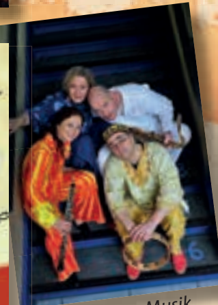
Elementare Musik für die ganze Familie